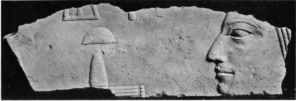
Reliefbildnis des Hemium aus seinem Grabe in Giza (Museum of Fine Arts in Boston).